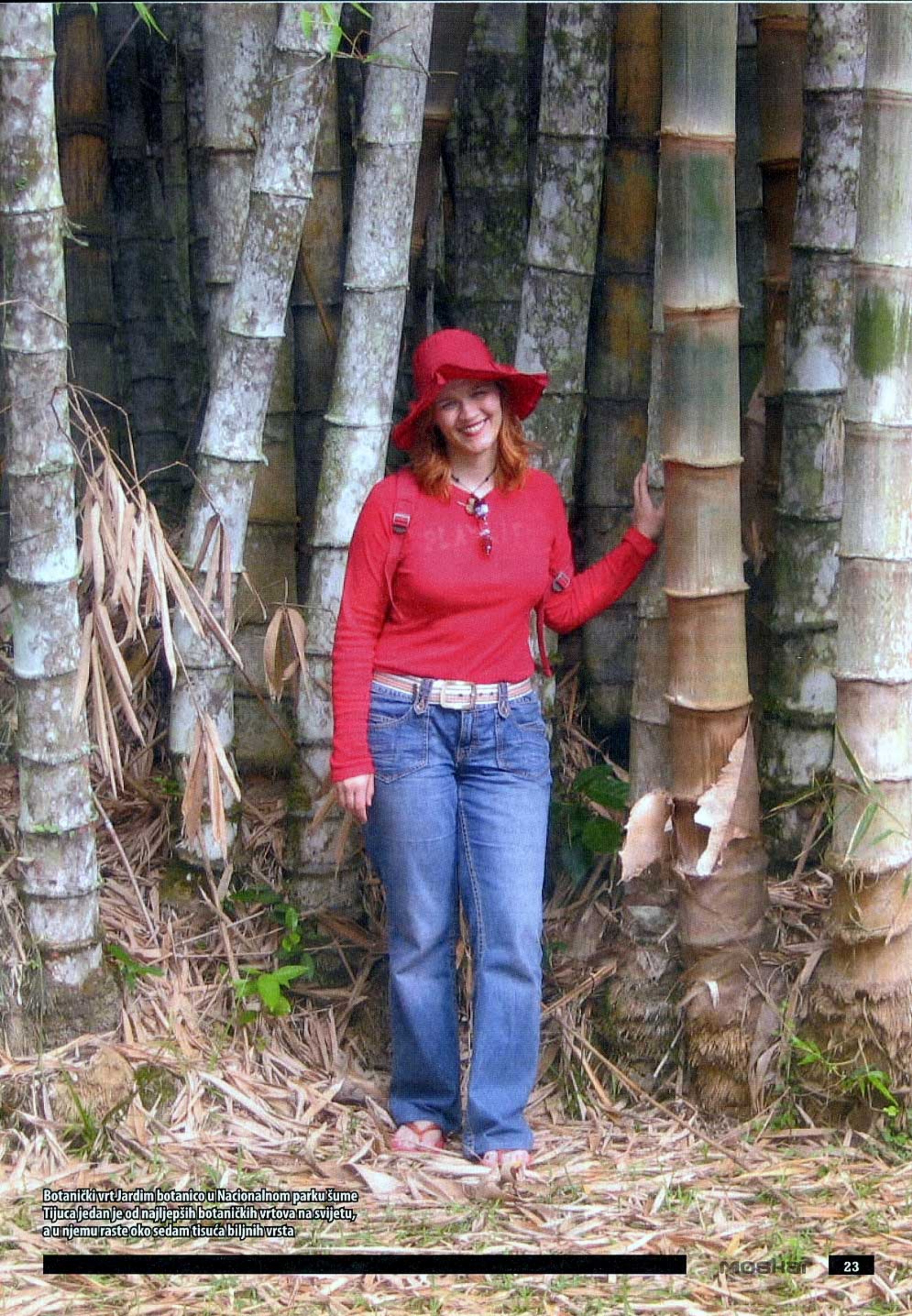
Botanički vrt Jardim botânico u Nacionalnom parku šume Tijuca jedan je od najljepših botaničkih vrtova na svijetu, a u njemu raste oko sedam tisuća biljnih vrsta